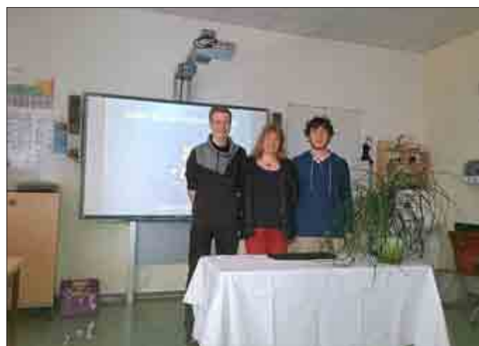
„Internet - Freund oder Feind“