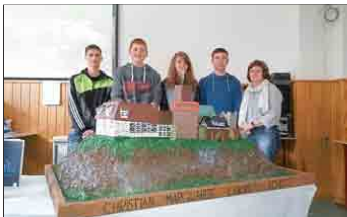
„Die Wartburg und das Leben früher“