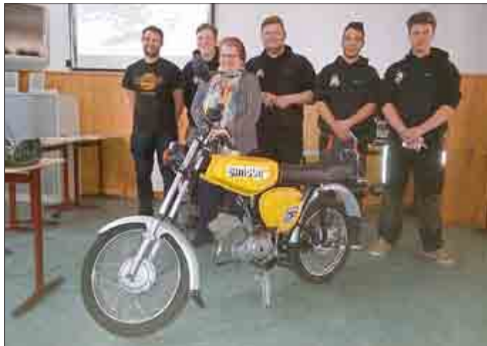
„Geschichte von SIMSON Suhl“