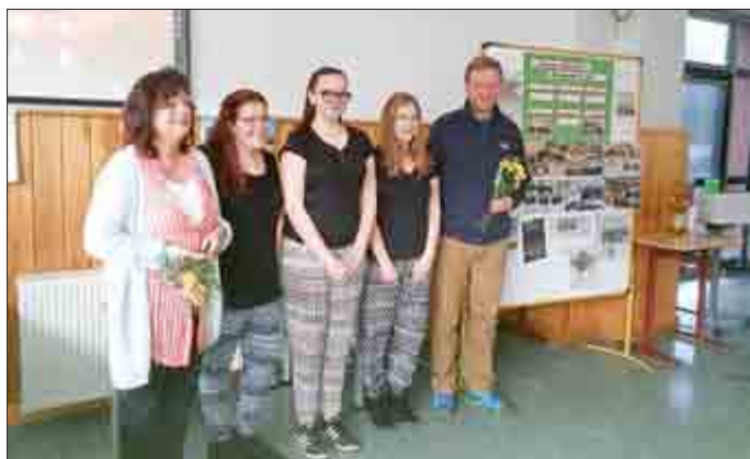
„Percussion - Miteinander im Takt“